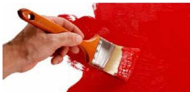
SE POATE VOPSI