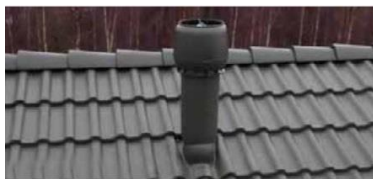
SISTEME DE VENTILAȚIE